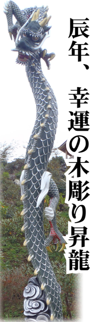
辰年、幸運の木彫り昇龍

標高 500m に 228 種類、10,000 本の ダリアの花が咲きほこります！ 是非、皆様の御来園をお待ちしています。